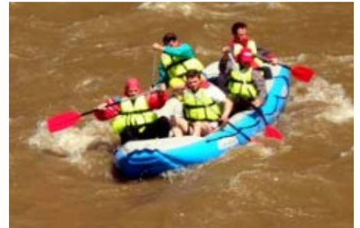
Rafting sur la rivière de Bistrita

Le matin, transfert de 30 minutes vers la région de Dorna pour une autre activité – rafting sur la rivière Bistrita . Déjeuner: pique-nique. Dans l'après-midi, transfert vers la ville de Piatra-Neamt, sur une route panoramique au bord du lac Bicaz. Dîner et hébergement dans un hôtel 3 étoiles.