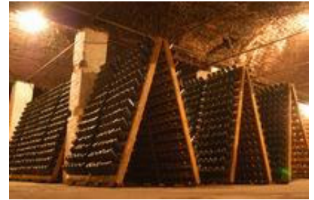
Les celliers Urlati

Dîner et hébergement dans une pension 3 étoiles.